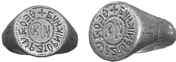
Рис. 1. Золотой перстень-печать Феодоры Торникины

том перстне Ласкарины Палеологины 2 , а также на щитке бронзового перстня с серебряной инкрустацией монограммы «Палеолог» (XIV в.), который был найден в крепости на мысу Чиракман и хранится в историческом музее г. Каварны 3 .