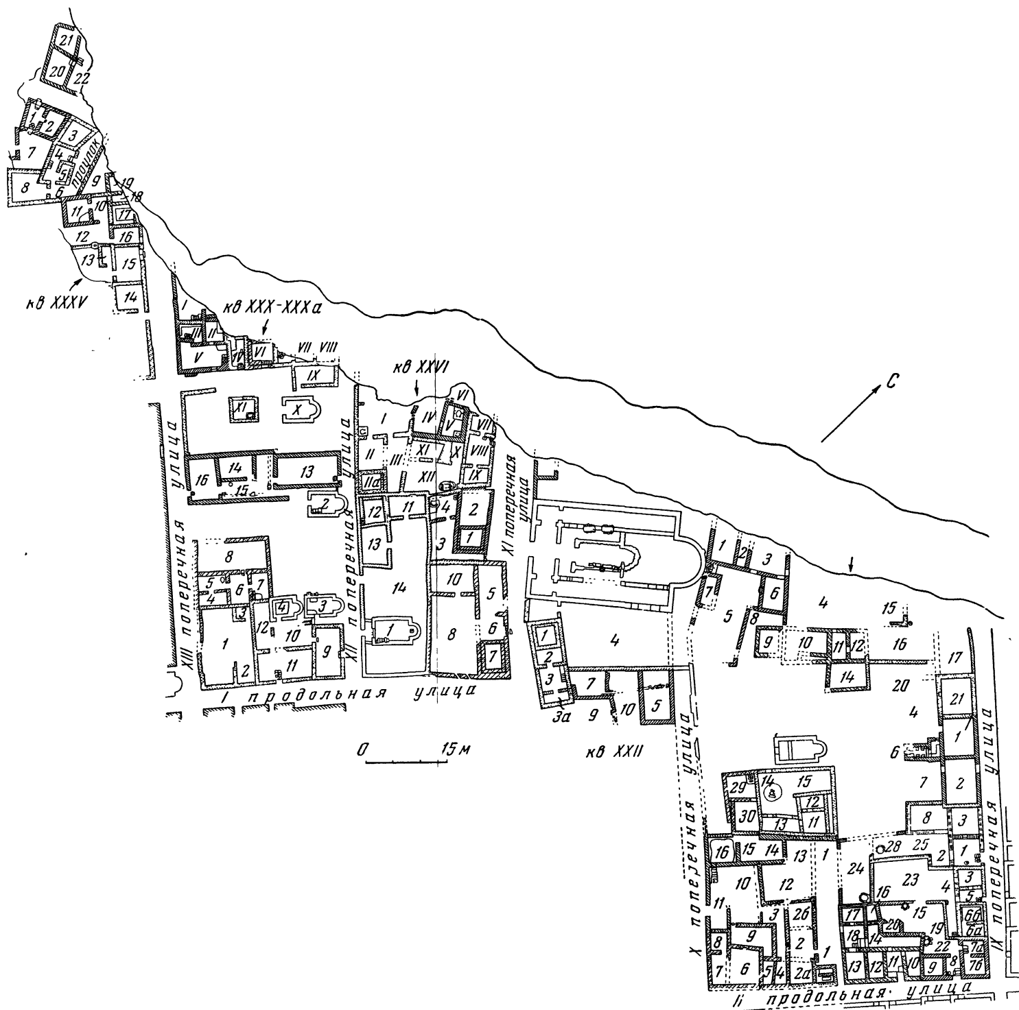
Рис. 3. Херсонес. Жилые кварталы XII—XIII вв. в северной прибрежной части городища