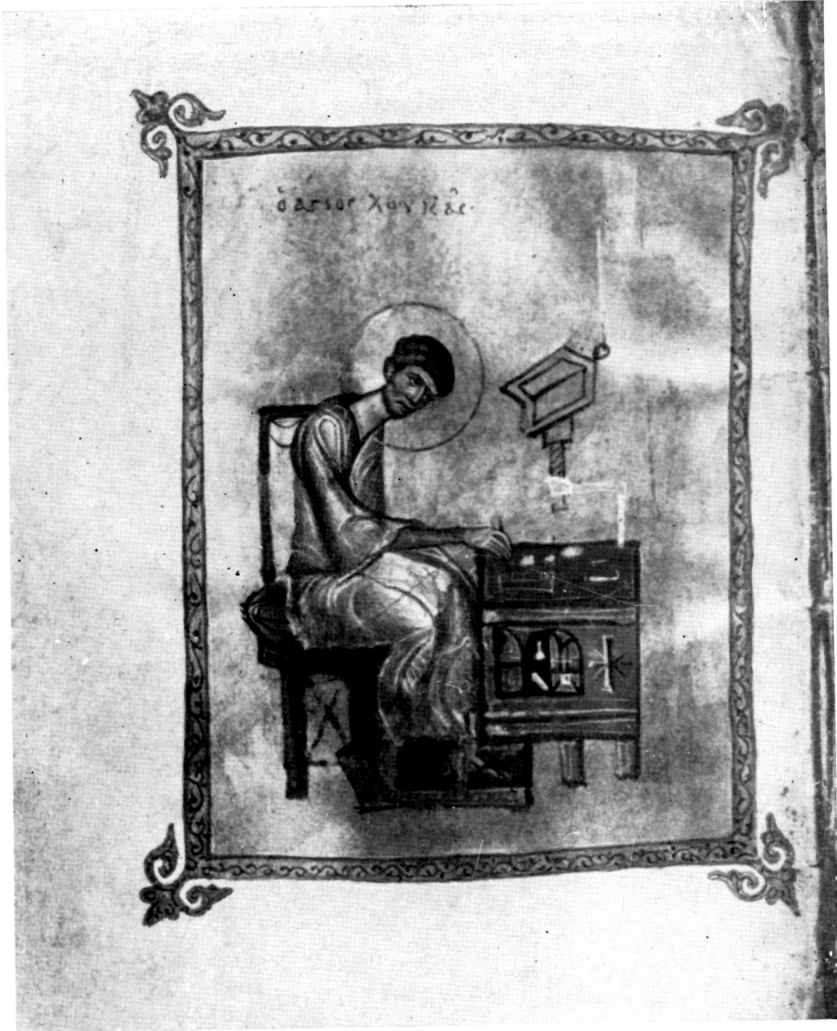
Рис. 4. Евангелие Греч. № 801. Евангелист Лука (л. 123 об.)