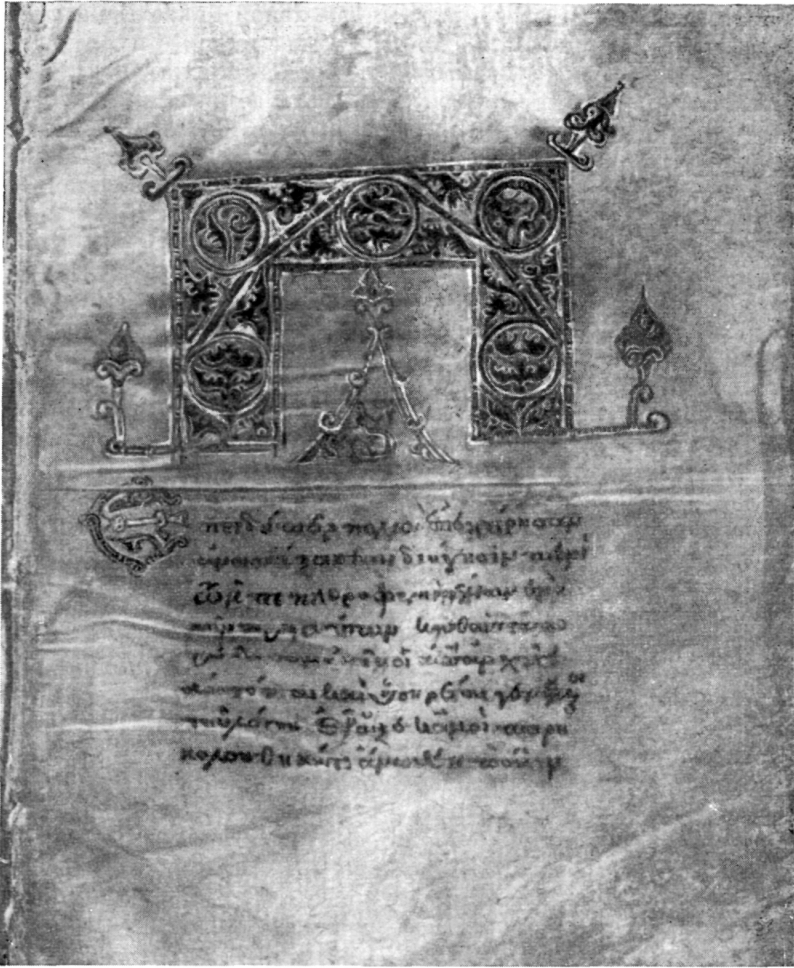
Рис. 3. Евангелие Греч. № 801. Начальный лист евангелия от Луки (л. 124)

Пурпурный пергамен в период после иконоборчества был чрезвычайно редок 18 . Применение его в рукописи Гр. № 801 свидетельствует о богатстве отделки и исключительном назначении Евангелия, выполненного, несомненно, в придворной школе и предназначенного для кого-либо из членов царской семьи.