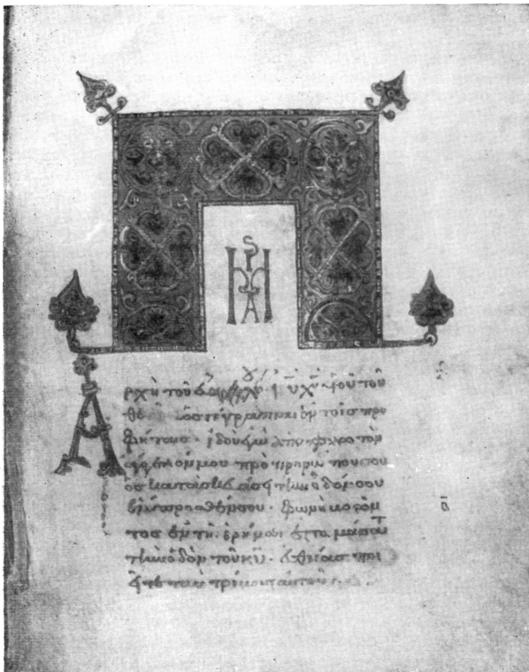
Рис. 2. Евангелие Греч. № 801. Начальный лист евангелия от Марка (л. 80)

где круги соединены непараллельными линиями. Эти расположенные под прямым углом друг к другу диагонали позволяют выделить центр, создавая центростремительную композицию. Находящийся на том же листе инициал Ε имеет форму незавершенного круга с поперечной перекладиной, проходящей ровно в центре. Такого же рода буква Ε, украшенная растительными побегами, листьями, усиками, встречается в Псалтири Ленинградской публичной библиотеки Гр. № 214 (л. 23, л. 59) XI в., в Евангелии, хранящемся на Патмосе, № 72 (XI в.) 17 , и во многих других рукописях XI в. Колористическая гамма заставки и инициала на листе 124 производит впечатление красочности и богатства особенно благодаря окрашенному пурпуром пергамену.