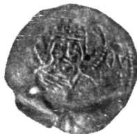
Рис. 3. Новый тип монеты Давида Строителя. Инв. № 1628.