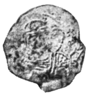
Рис. 2. Новый тип монеты Давида Строителя. Инв. № 2853.

В 1948 г. мы побывали в Верхней Сванетии, но, к величайшему нашему огорчению, не обнаружили на месте этой монеты и уже считали ее пропавшей, когда в 1949 г. совершенно неожиданно она снова появилась. В Музей Грузии ее доставил директор того же института, действительный член Академии наук Грузинской ССР проф. Г. Н. Чубинашвили, побывавший в Сванетии уже после нас. Появление этой монеты (журнал поступлений № 137 от 12/1 1949 г., инвентарный № 1628) было такой неожиданностью, что, не обратив должного вни-