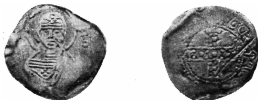
Рис. 1. Общеизвестный тип монеты Давида Строителя.

Об. ст. В центре — вписанный в точечный круг и украшенный крупными точками равноконечный крест, вокруг которого располо-