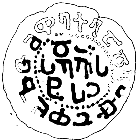
Рис. 6. Восстановленная полная надпись с увеличенных фото монет №№ 2853 и 1628.

Таким образом, можно считать установленным, что до того как внести в монетный тип дополнение в виде креста, заполняющего центральный круг, первые выпуски своих монет Давид Строитель чеканил по уже установленной его предшественниками схеме. Таким образом, тип монеты, введенный Багротом IV приблизительно между 1050 и 1060 гг. (когда ему был присвоен титул новелисимоса), продержался не только при Георгии II, но и первые годы управления Давида, т. е. не менее 30—40 лет. Благодаря этим двум монетам восполняется также и отсутствующий конец легенды на описанной выше серебряной монете (рис. 1), что действительно представляло „очень досадный пробел“, так как на определенном этапе своего правления Давид Строитель, видимо, весьма недвусмысленно решил переместить свой византийский титул с центрального места на самый край монеты. 3 Наконец, надписи двух этих новых монет говорят и о том, что вопреки мнению Е. А. Пахомова, 4 „территориальный титул“, вроде „абхазцев царя“, не исчезал хотя бы на первых монетах Давида Строителя.