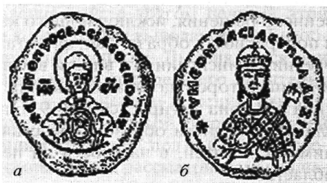
Рис. 2 а, б. Прорись моливдовула царя Симеона