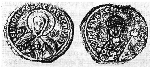
Рис. 3 а, б. Прорись моливдовула царя Симеона с пожеланием долголетия из Национального исторического музея в Софии