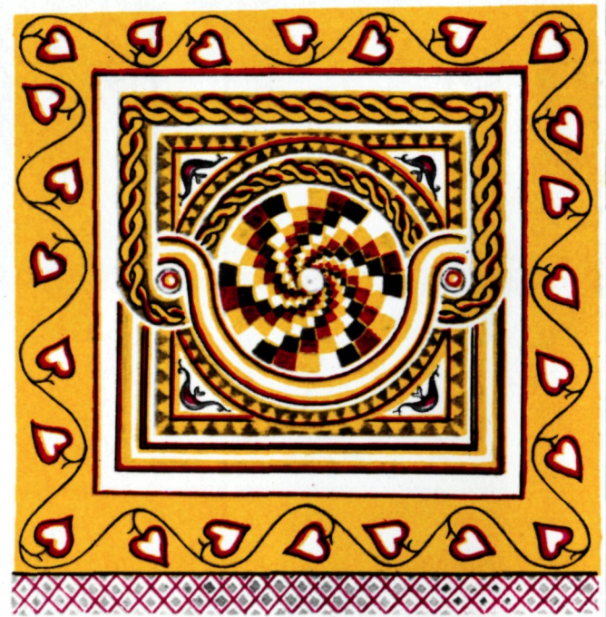
Рис. 2. Мозаика базилики на холме. Фрагмент.