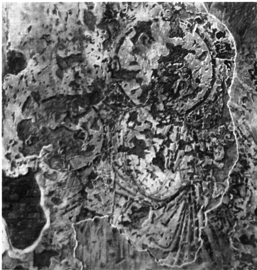
Рис. 2. Фрагмент первого слоя росписи апсиды, фигуры ангела и, возможно, апостола Петра (Wilpert J. Die römischen Mosaiken... IV. Pl. 141, 3)

ции с двумя сильно поврежденным фигурами в левой части (рис. 2). Вильперт идентифицировал фигуру слева, ближе к краю ниши, как апостола Петра, узнаваемого по седым вьющимся волосам и короткой бороде, а фигуру ближе к центру – как ангела 12 . Кроме того, правее были остатки еще одной головы с нимбом, видимо, второго ангела, а в верхней части апсиды – красный полукруг. Все вместе взятое позволило сразу предположить, что справа был апостол Павел, а в центре – или Христос, или Богородица. Штукатурка этого слоя лежит непосредственно на цементе, под ней нет предыдущих слоев 13 , что позволяет отнести ее к первой по времени декорации здания после превращения его в церковь 14 .