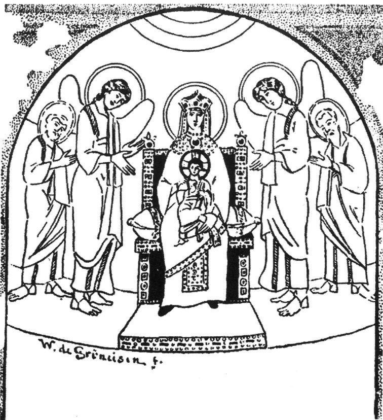
Рис. 4. Реконструкция композиции апсиды Санта Мария Антиква при Иоанне VII по Грюнайзену ( Grueneisen W. de. Sainte Marie Antique... Pl. IC. L )

собственный вариант реконструкции данной композиции (рис. 4) 25 ; центральную ее часть занимает условная, составленная из элементов других изображений такого рода фигура Maria Regina (рис. 5) 26 .