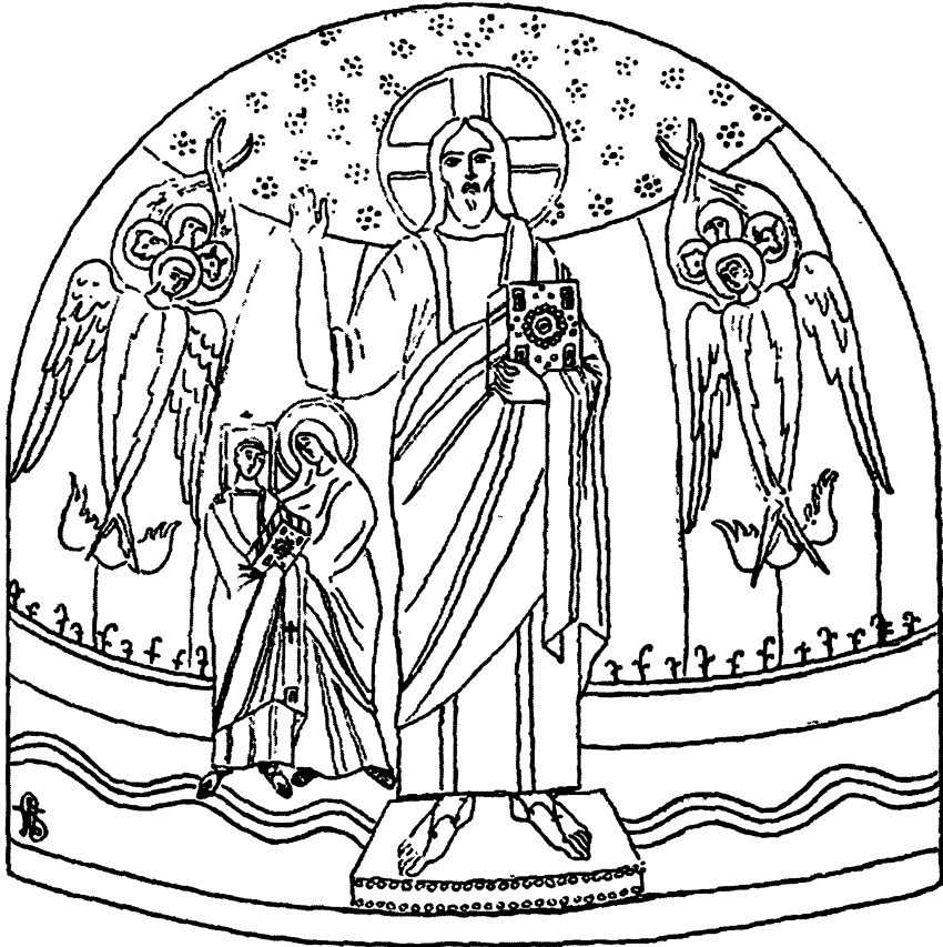
Рис. 5. Реконструкция композиции апсиды Святой Марии Антиквы при Павле I по Грюнайзену ( Grueneisen W. de. Sainte Marie Antiquae... P. 173)

В 1960 г. в свет выходит книга немецкой исследовательницы Кристи Им об апсидах христианских церквей в IV–VIII вв. 27 ; в 1992 г. следует переиздание 28 . И на его страницах вновь предстает реконструкция Грюнайзена, но без всякого упоминания ее гипотетичности, как очевидный факт 29 . В 1994 г. в статье, посвященной образам Теофании в раннесредневековом искусстве 30 и