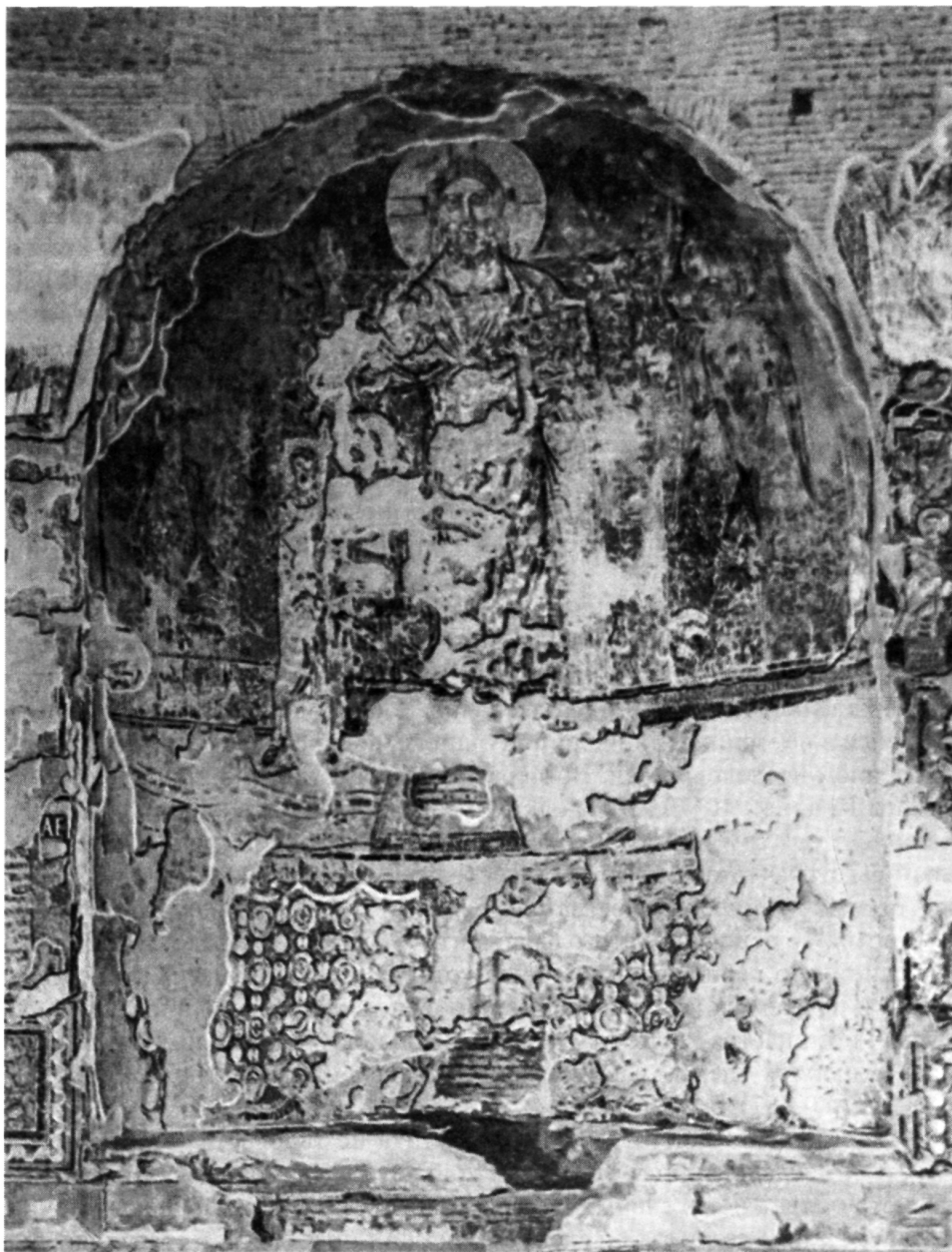
Рис. 1. Апсида церкви Санта Мария Антиква ( Wilpert J. Die römischen Mosaiken... IV. III. 151 )