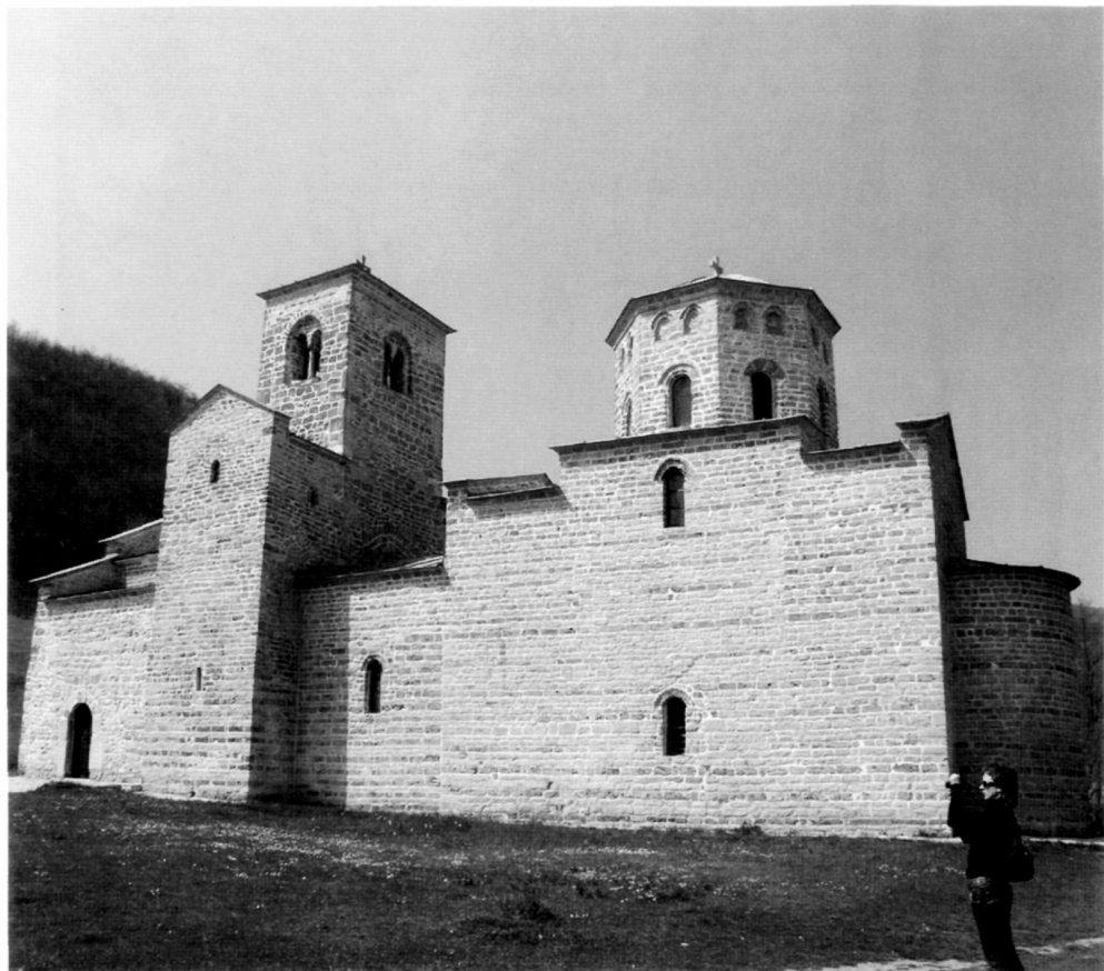
Рис. 12. Церковь св. Георгия в Будимлье.