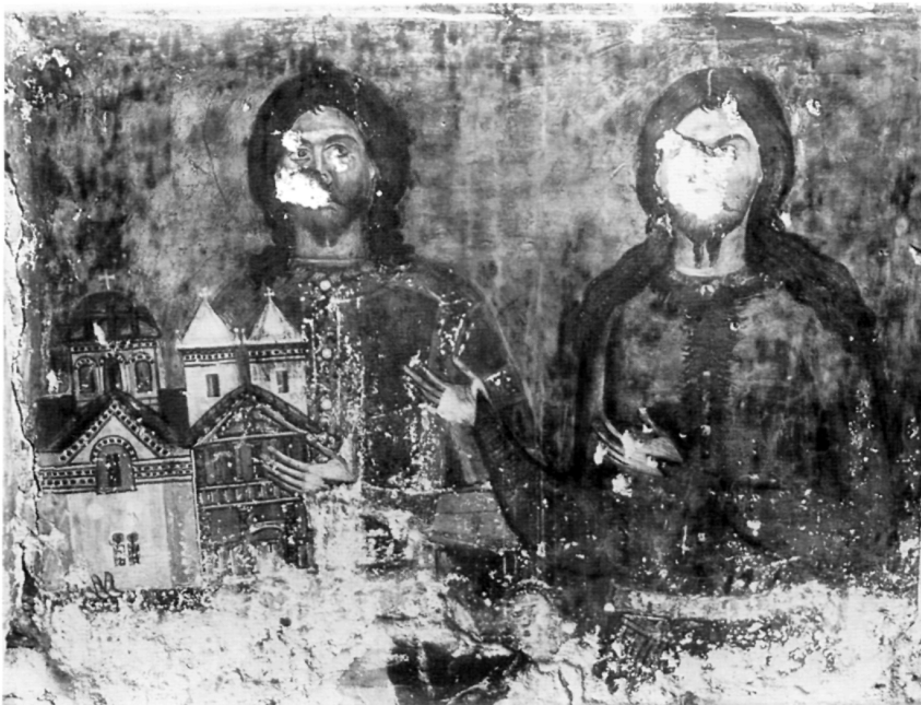
Рис. 3. Ктиторская фреска на западной стене наоса.