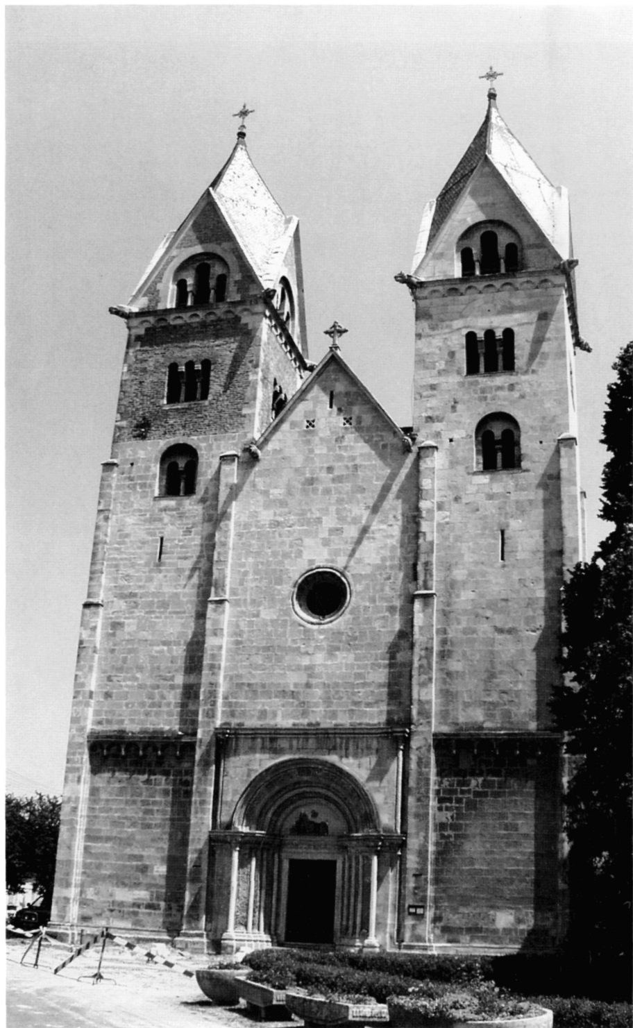
Рис. 14. Церковь св. Якова бенедиктинского аббатства в селе Лебень, 1208 г.