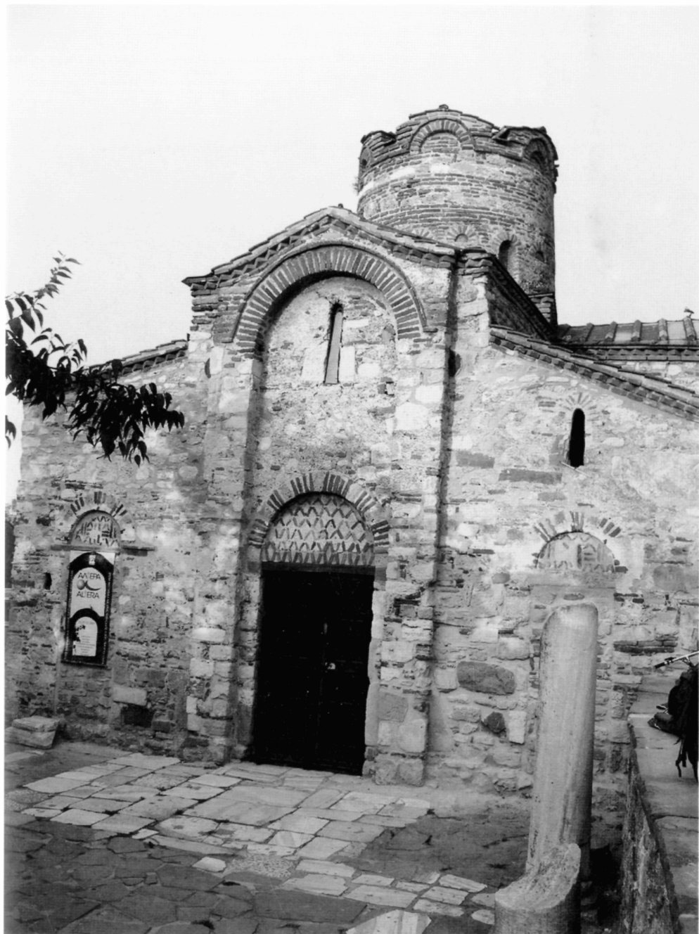
Рис. 10. Церковь Иоанна Крестителя в Несебре.