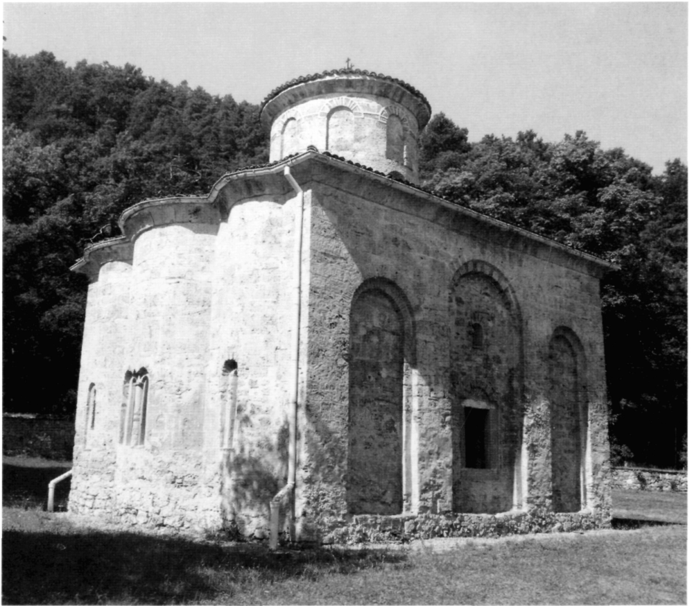
Рис. 11. Церковь Иоанна Богослова в Земенском монастыре.