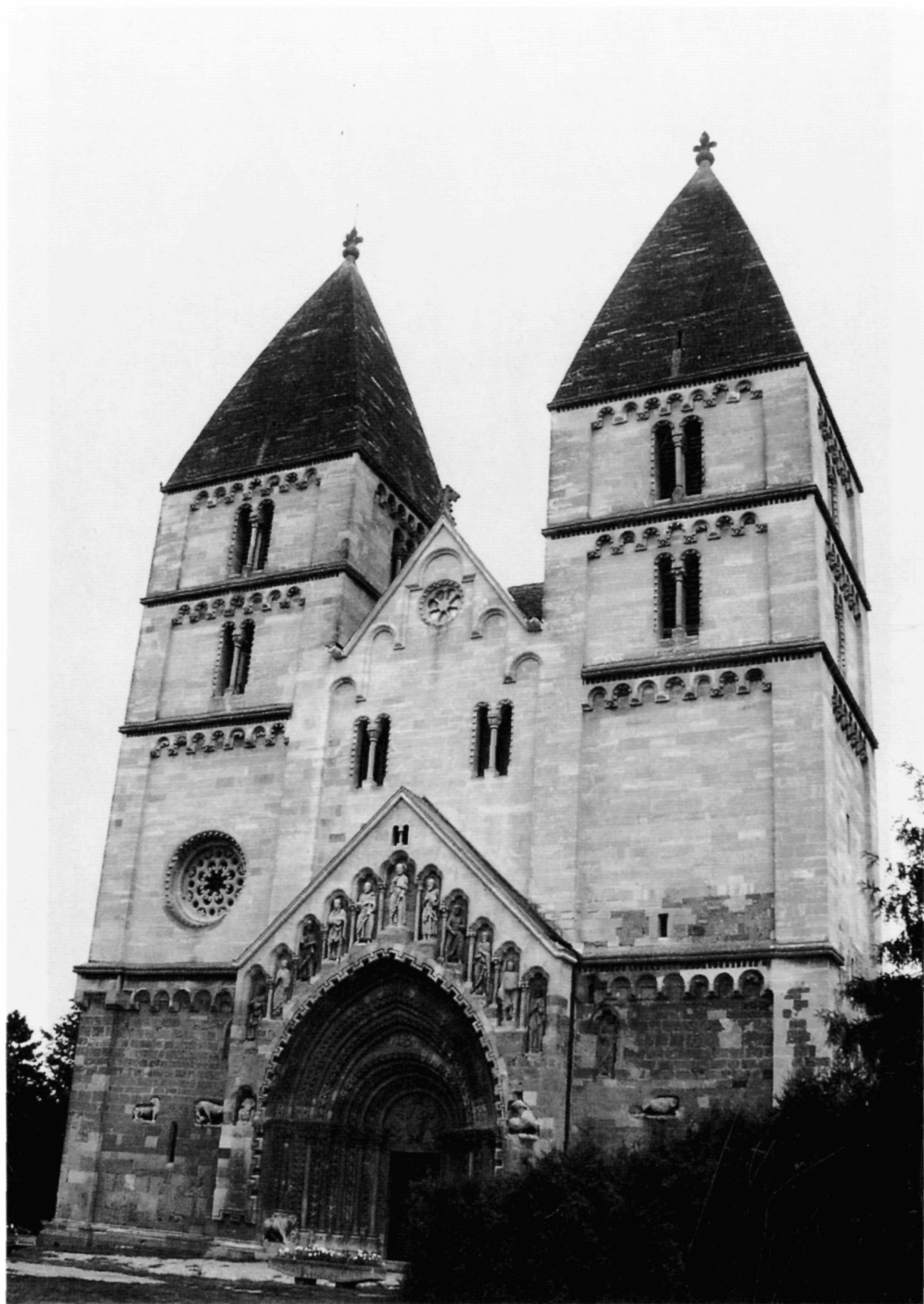
Рис. 15. Церковь св. Георгия бенедиктинского аббатства в селе Як, 1214 г.