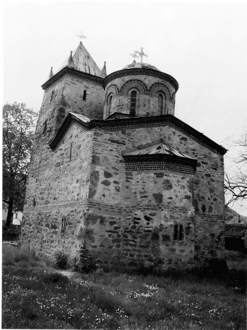
Рис. 9. Церковь в селе Донья Каменица, вид с востока после реконструкции купола.