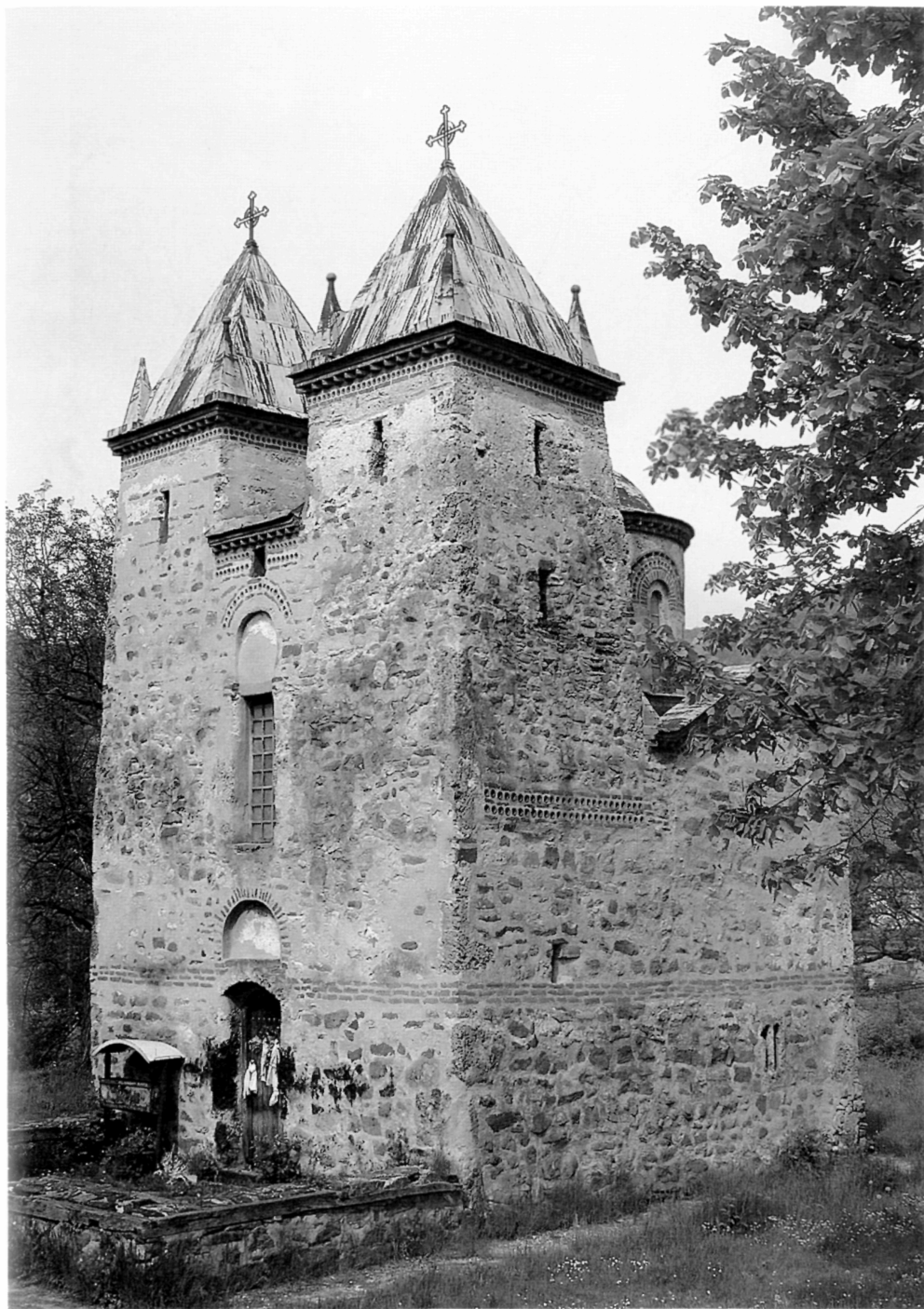
Рис. 1. Церковь в селе Донья Каменица, вид с юго-запада