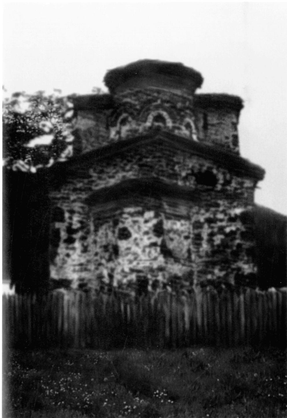
Рис. 8. Церковь в селе Донья Каменица, вид с востока до обрушения купола. Бошковић Ђ Белешке са путовања. Ил. 5 на с. 280