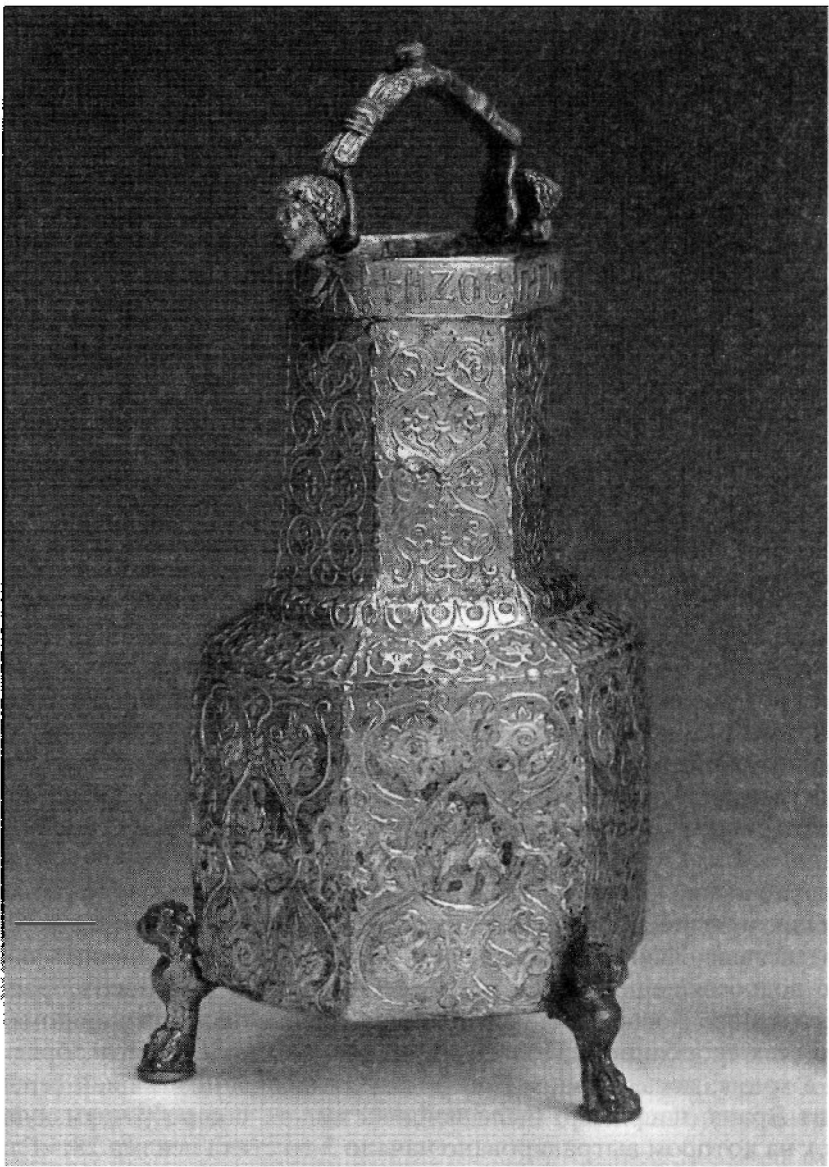
Рис. 5. Серебряное позолоченное ведро для святой воды из Бестерека (Восточная Венгрия). XI – начало XII в. Венгерский национальный музей в Будапеште

пится сходным образом, только вместо полых полусфер здесь литые человеческие головы. К дужке, судя по ее конструкции, также должна была крепиться цепочка. Подобное крепление дужки отмечается и у нескольких ведерок для святой воды западного происхождения. Впервые же сосуд такого типа был упомянут в 1090 г. в описи бенедиктинского монастыря на горе св. Мартина (ныне Паннонхалма) в Западной Венгрии 53 .