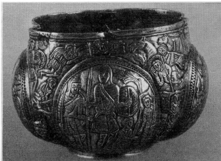
Рис. 4. Серебряная позолоченная чаша из Влоцлавека. X в. Музей народов в Кракове

как сосуд светского назначения. Однако такие надписи обычны и для votивных предметов, которые использовали для домашней молитвы 50 или дарили в храмы, указывая имена жертвователей в текстах молитвенных обращений. Таким образом, хотя содержание надписи не позволяет считать киевский сосуд предметом литургической утвари, однако оно и не исключает вероятности того, что чашу могли пожертвовать в храм для богослужебных целей.