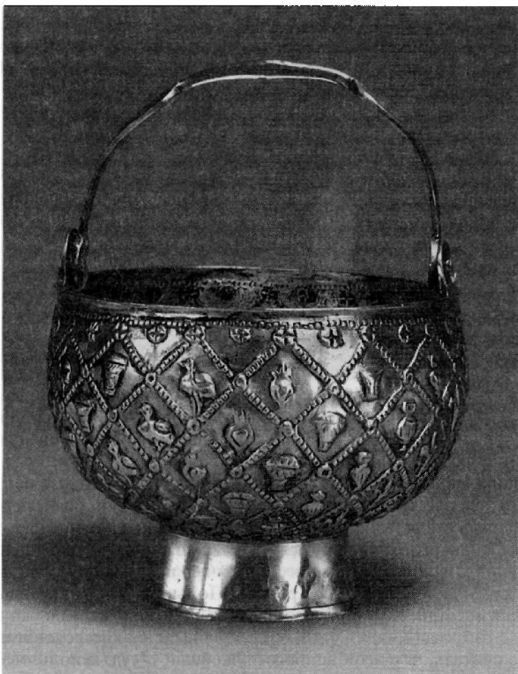
Рис. 3. Серебряная чаша из деревни Врап в Албании. VIII в. Метрополитен музей. Нью-Йорк

X–XI вв.: Евангельские чтения Парижской национальной библиотеки (вторая половина X в.), Трапезундское Евангелие из Армении (середина XI в.) и Евангелие Иверского монастыря на Афоне (1075–1150), и др. 39