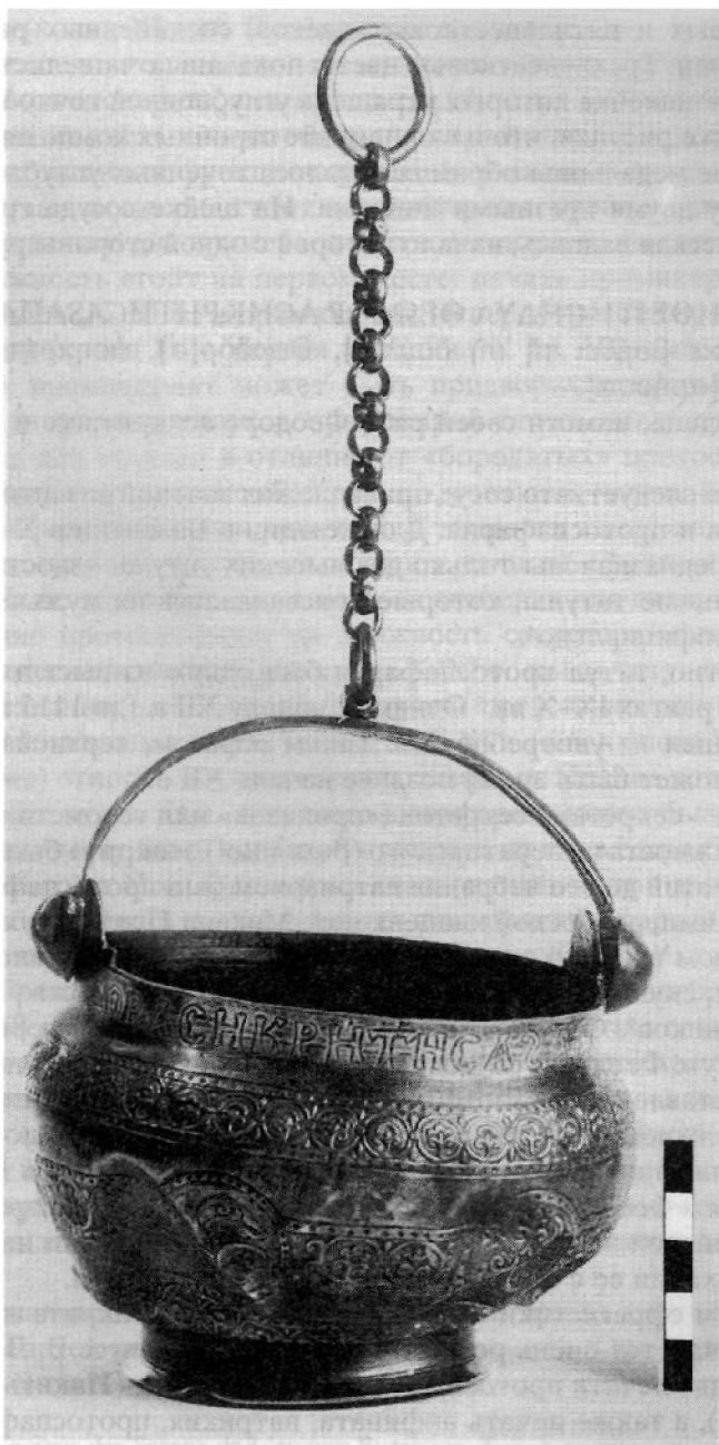
Рис. 1. Серебряная чаша асикритиссы Феодоры. Середина – вторая половина XI в. Национальный музей истории Украины. Киев

наментом), украшенных по краям двумя растительными завитками. В крупные медальоны, чередуясь, вписаны орнаментальные композиции двух видов. Одна представляет собой стилизованный букет из полупальметт и спирально закрученных завитков, загнутых в противоположные стороны. Другая композиция состоит из шести расположенных веночком чередующихся